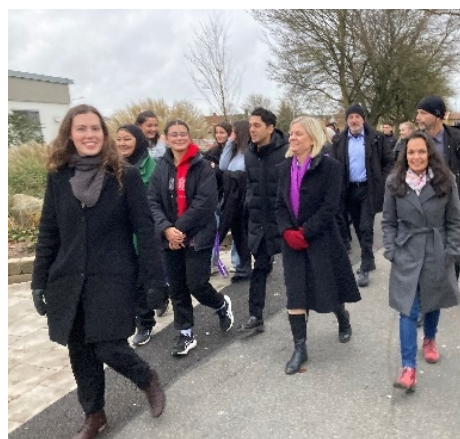
Några av deltagarna vid besöket

Arbetet har som mål att utveckla hela Näsby styrkor, öka samverkan och samhörighet och stötta pågående insatser inom stadsdelen. Drog- och brottsförebyggande samordnaren har deltagit från Arbete och välfärdsförvaltningen i arbetet med Näsby Stadsutveckling. Bland annat har det påbörjats ett arbete med att ta fram en lokal trygghetskarta för medborgarna. Under hösten fick Näsby Stadsutveckling tillsammans med det Brottsförebyggande arbetet besök av förre detta statsministern Magdalena Andersson som ville lära känna området och de insatser som görs.