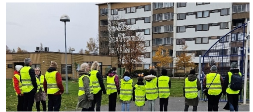
Några av deltagarna på trygghetsvandring i Charlottesborg

I Charlottesborg anordnades en trygghetsvandring utifrån barnens perspektiv, där deltog förutom barn även representanter från andra boende, HSB, Polisen, politiker och Lokala Brottsförebyggande rådet. Förutom detta genomfördes även en trygghetsvandring i Tollarp.